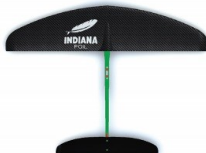
DLOUHÁ délka trupu

Maximální stoupací odpor Nejvyšší stabilita Maximální odpor zatáčení