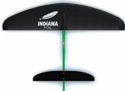
KRÁTKÁ délka trupu

Maximální volnost Nejvyšší rychlost otáčení Nejlepší výkon při pumpování