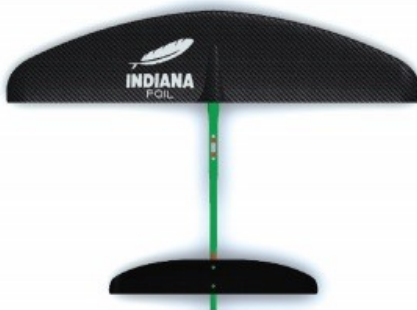
STANDARDNÍ délka trupu

Dobrá rovnováha mezi stabilitou a výkonem.